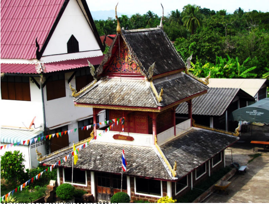
หอยเตรโบรา ณ วัดเหมืองหม้อ